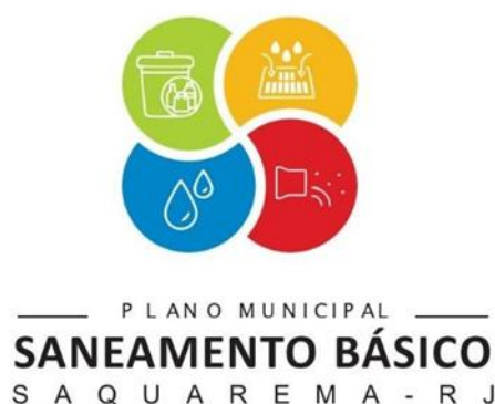
Figura 3: Logomarca do Projeto PMSB.

A equipe técnica de comunicação da Prefeitura de Saquarema conta com o trabalho de um designer que criou a identidade visual do Projeto. Este trabalho visa conferir uniformidade e uma associação imediata do público envolvido com o projeto nos diversos meios de mobilização utilizados. Desta forma, os padrões a serem empregados nos meios e materiais gráficos utilizados terão a logomarca do projeto e seguirão a um mesmo padrão estético.