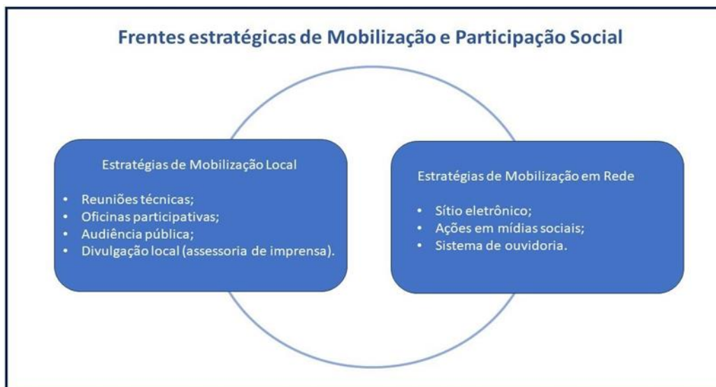
Figura 2: Frentes Estratégicas.

O desenho metodológico prevê uma estratégia de atuação em duas frentes: Estratégia de Mobilização Local e Estratégia de Mobilização em Rede, executada diretamente pelo Consórcio Pro-Saquarema e apoiada ou potencializada pelos Grupos de Trabalho.